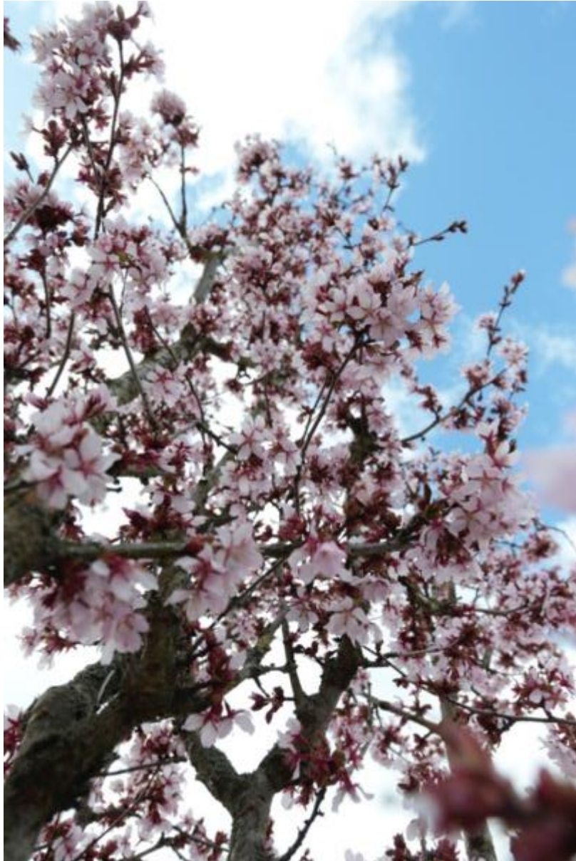
Vinnare fotograf 4

Vinner på att ha tolkat kaos "out of the box". Ett blommande fruktträd associerar i första hand till andra ord än kaos, men likväl är det absolut en sorts kaos. För att citera Wikipedia: " Inom naturvetenskapen är kaos inte liktydigt med oordning, utan i stället en benämning på en särskild form av ordning där en liten förändring i begynnelsevillkoren kan orsaka en drastisk förändring vid en senare tidpunkt." Insectens visit som leder till en frukt är ju en högst drastisk förändring.